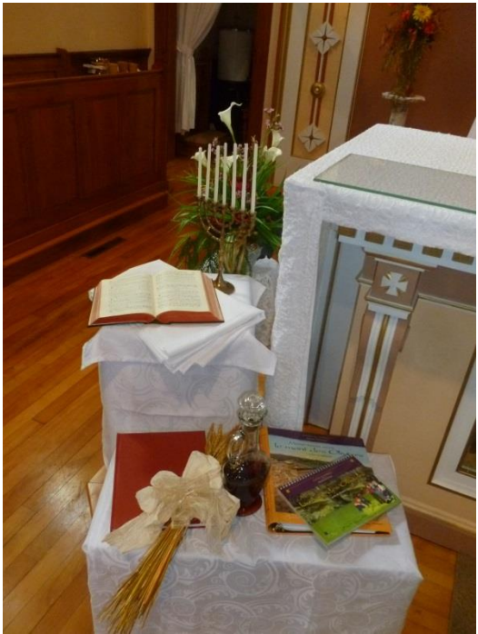
Offrandes déposées pendant la messe